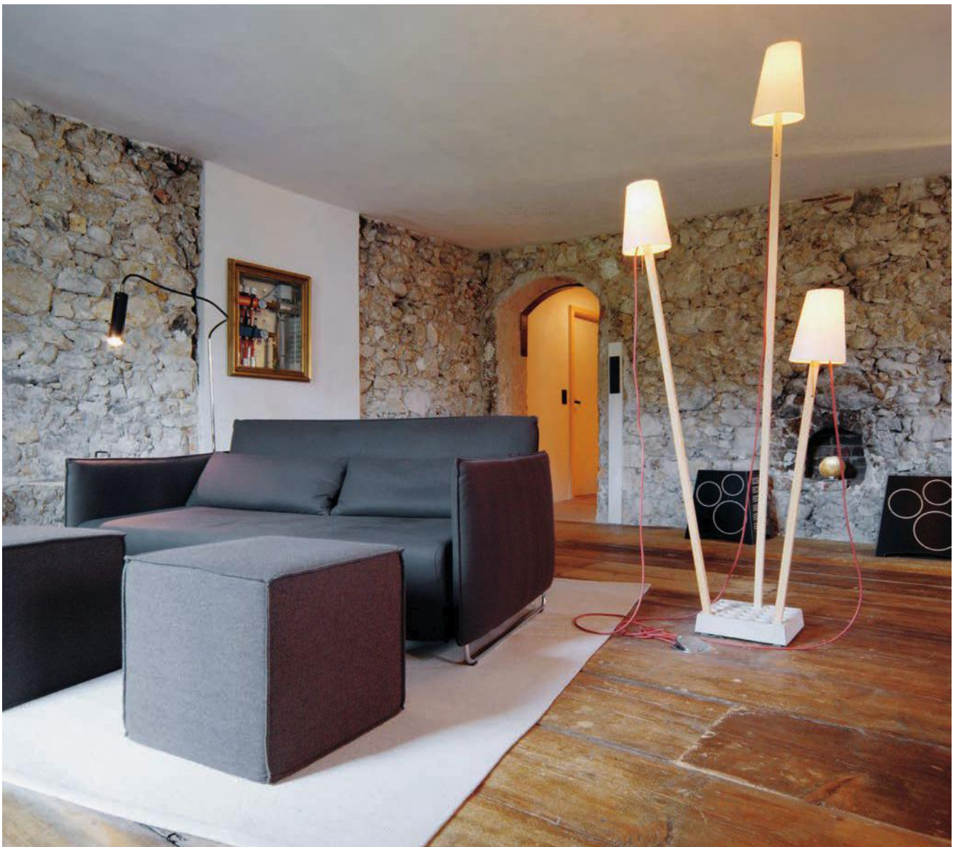
berge: Liftstube Wohnzimmer, Foto: Jäger & Jäger